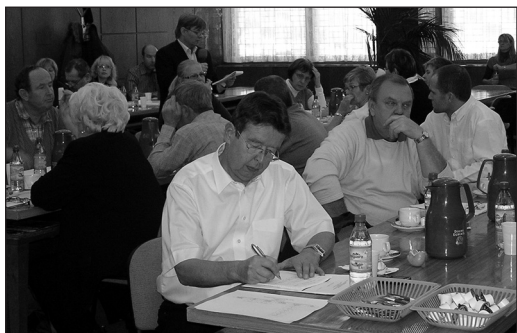
Členové pléna při jednání