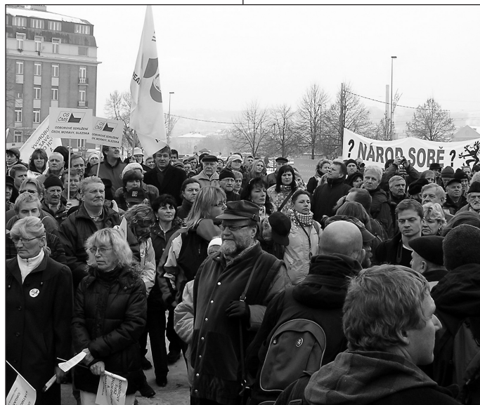
Účastníci protestního shromáždění v Praze

„Účast v Jihlavě, kde jsem byla (zhruba 300 lidí), byla podle mého názoru slabá. Většina občanů tohoto státu vidí za stávkou jenom úředníky, ale už ne hasiče, lékaře a policisty. Ti všichni pocítí úsporná opatření hned v novém roce ve mzdách, my ostatní zanedlouho poté. Kam až bude muset naše vláda ‚rozpočtové odpovědnosti‘ zajít, aby se ozvali i ostatní?“